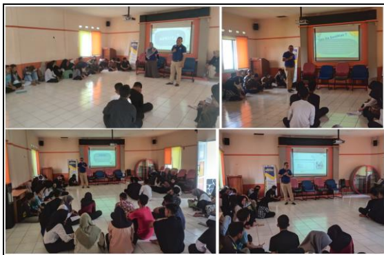
Gambar 3 Penyampaian Materi Kualitas

Output dari kegiatan pertemuan keempat ini, para peserta dapat mengetahui arti dari pentingnya sebuah kualitas, sehingga ketika nanti dalam membuat produk mereka akan benar-benar memperhatikan kualitas, baik dari proses awal pemilihan bahan baku, proses produksi, sampai produk akhir yang dijual/dikirim ke pelanggan itu benar-benar berkualitas yang sesuai dengan keinginan dari customer (voice of customer), serta mampu menjaga kualitas dengan senantiasa meningkatkan kualitas pelayanan untuk kepuasan pelanggan. Adapun dokumentasi kegiatan pada pertemuan keempat adalah sebagai berikut: