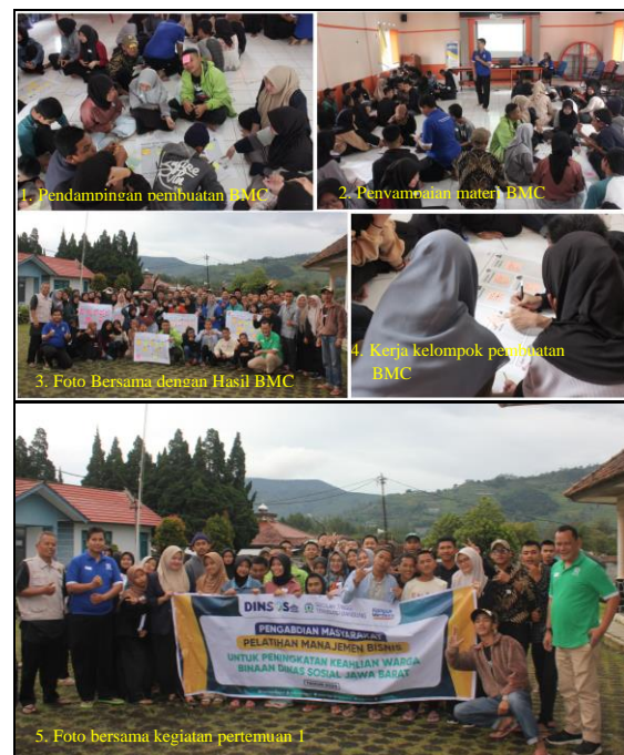
Gambar 1 Pelatihan Bisnis Model Canvas (BMC)

Output yang dihasilkan dari pelatihan pada pertemuan pertama ini, para peserta lebih memahami strategi dalam perencanaan bisnisnya, dapat mengetahui kebutuhan dari pasar, keunggulan dari produknya, bagaimana cara menyalurkan produknya, mengetahui sumber daya yang diperlukan, mitra yang terlibat, dan dapat mengetahui biaya dan keuntungan dari bisnis yang akan dijalankan. Sehingga dengan perencanaan seperti ini para peserta dapat lebih memahami strategi apa yang harus dilakukan. Adapun dokumentasi kegiatan pada pertemuan pertama adalah sebagai berikut: