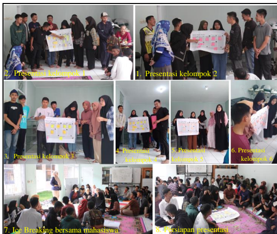
Gambar 2 Presentasi dan Revisi BMC

Output dari kegiatan pertemuan kedua ini, para peserta dapat melakukan koreksi dan perbaikan dari perencanaan bisnisnya, sehingga perencanaan bisnisnya menjadi lebih baik. Adapun dokumentasi kegiatan pada pertemuan kedua adalah sebagai berikut :